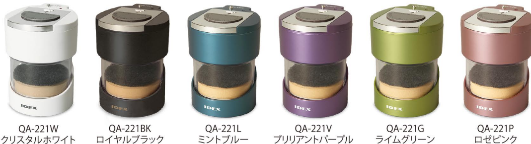
QA-221W クリスタルホワイト QA-221BK ロイヤルブラック QA-221L ミントブルー QA-221V プリリアントパープル QA-221G ライムグリーン QA-221P ロゼピンク